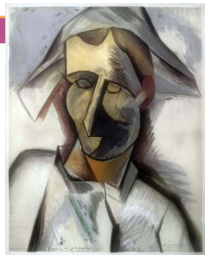
Arlequim, litografia de Picasso

Segundo esse levantamento, 40% dos estudantes admitiram envolvimento em atos de bullying, como autores ou alvos, ou ainda em papel duplo – às vezes enquadrados em um caso, às vezes noutro. Destes, 28% admitiam ser alvos. Um dado interessante é que 60% dos alunos afirmaram que o bullying ocorre com maior frequência dentro da sala de aula, o que contraria os estudos internacionais. A percepção era de que as agressões aconteciam, principalmente, na hora do recreio, momento de maior informalidade e descontração. Mas, 80% dos alunos admitiram que o bullying motiva um sentimento negativo e reconheceram que isso provoca uma repercussão ruim