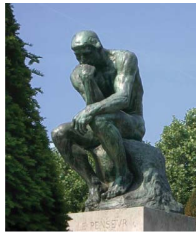
O Pensador - Rodin

Para dar legitimidade à segunda teoria deve-se impedir que instituições educacionais, considerem-se como de assistência social, e contabilizem atividades de extensão exercidas por alunos no processo de sua formação e aprendizagem (inerentes ao próprio conceito de educação superior), como atividades que merecem a imunidade tributária. Na área médica um apoio da Faculdade particular, para que uma ONG realize um trabalho com carentes é obrigação e não merece isenção tributária. Contudo, a solução não é acabar com a filantropia, mas, qualificá-la. Esse é o objetivo de transformar os 20% de gratuidade a que as filantrópicas estão obrigadas, exclusivamente, em bolsas de estudo integral. Como conceber uma entidade filantrópica de educação superior cuja finalidade precípua não seja incluir o jovem carente na universidade?