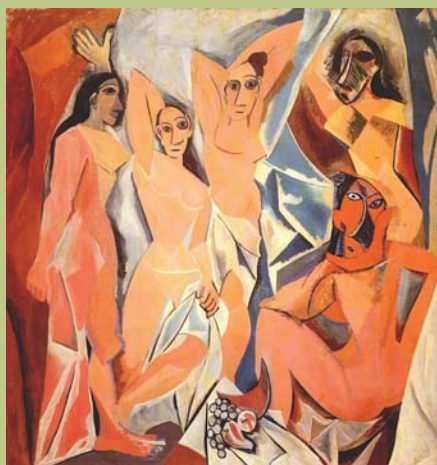
Les Femmes d'Alger