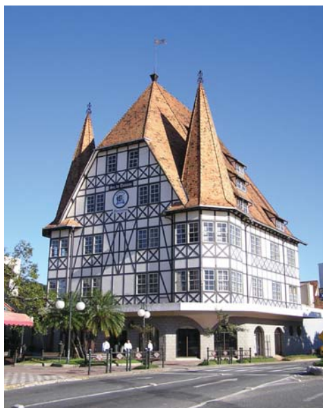
Castelinho da Havan

Os relevos, geralmente oriundos do neoclássico e do art-déco, são figuras geométricas no interior dos frontões, sobre ou sob as janelas, portas, escadas, sacadas.