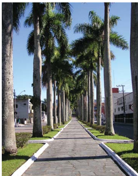
Alameda Duque de Caxias