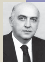
Presidente de honra do Congresso Brasileiro de Reumatologia de 2006

de Brasileira de Reumatologia, da Panlar, vice presidente da Ilar e da Academia Brasileira de Reumatologia (cadeira 31). Na tertúlia de Campinas lembra o seu primeiro mestre (veja na página 8).